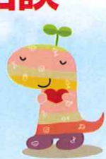
丹波電のちーたん

センターをはじめ、様々な相談窓口等とつながっていない方に対し、ご本人の希望や相談内容に応じて、家庭訪問や他機関への同行等を行います。